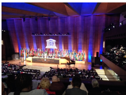
La salle 1 de l'UNESCO