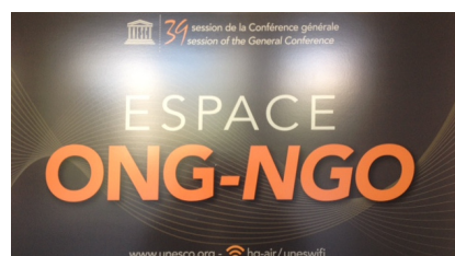
L'affiche de l'espace ONG